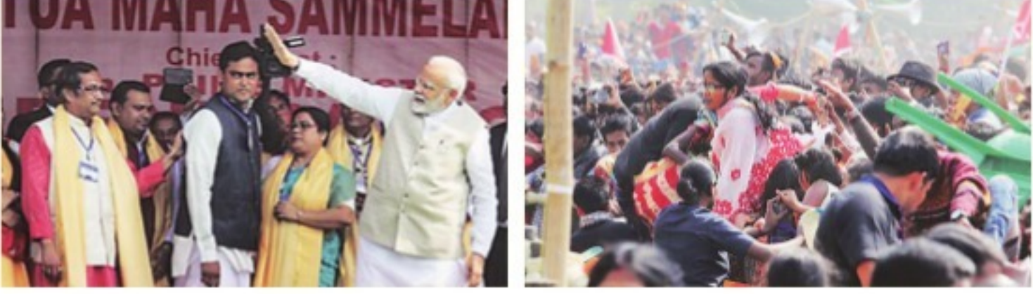
पश्चिम बंगालमधील उत्तर चोवीस परगणा प्रांतातील ठाकूरनगर येथे रविवारी झालेल्या आंतरराष्ट्रीय मातुआ महासंमेलनात आधी घर्षसभेच्या व्यासपीठावर उपस्थित असलेले पंतप्रधान नरेंद्र मोदी. दुसरे छायाचित्र या सभेला झालेल्या धावंड गर्दीचे.

पश्चिम बंगालमधील तृणमूल काँग्रेसच्या सरकारने मध्यमवर्गीयांच्या स्वप्नांचा चुराडा केल्याचा आरोप पंतप्रधान नरेंद्र मोदी यांनी येथील सभेत केला. राज्य सरकारवर त्यांनी खंडणीखोरीचा आरोप केला.